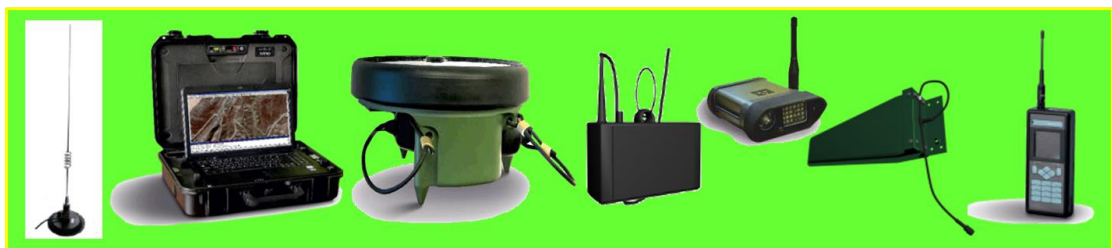
ภาพที่ 1 ชุดเฝ้าตรวจชายแดนและเครื่องมือพิเศษที่หน่วยได้รับมอบ

ปัญหาเรื่องความขาดแคลนยุทธโปกรณ์ยังคงเป็นปัญหาสำคัญสำหรับหน่วยที่ปฏิบัติงานด้านการปราบปรามยาเสพติด ปัจจุบันหน่วยยังไม่ได้รับเครื่องมือช่วยหรือสิ่งอำนวยความสะดวกในการตรวจค้นยาเสพติดโดยตรง จะมีเพียงเครื่องมือพิเศษที่หน่วยได้รับมอบได้แก่ ชุดเฝ้าตรวจชายแดน ซึ่งใช้สำหรับแจ้งเตือนการลักลอบข้ามผ่านแนวชายแดน ซึ่งอุปกรณ์ดังกล่าวยังมีจำนวนไม่เพียงพอ สำหรับเครื่องมือช่วยโดยตรงในการตรวจค้นยาเสพติดหน่วยยังไม่ได้รับ จะมีเพียงสุนัขทหารในการดมกลิ่นยาเสพติดจากชุดสุนัขทหารกรมการสัตว์ทหารบก ซึ่งสุนัขทหารที่พร้อมสามารถปฏิบัติงานได้ยังคงมีจำนวนไม่เพียงพอ และการใช้งานยังคงมีข้อจำกัด เช่น ห้วงระยะเวลาในการปฏิบัติงานที่จำกัดและสภาพแวดล้อมภูมิอากาศที่ไม่เอื้ออำนวยกับการปฏิบัติงานของสุนัขทหาร รวมถึงการเดินทางในการขนย้ายสุนัขทหารที่มีระยะทางที่ไกลและเป็นพื้นที่ทุรกันดารล้วนเป็นอุปสรรคและข้อจำกัดสำหรับการใช้สุนัขทหารทั้งสิ้น