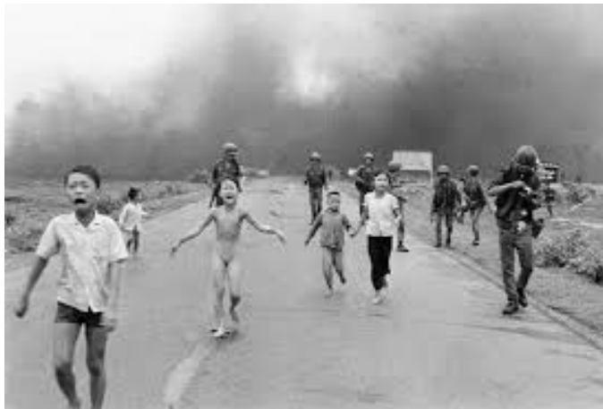
ภาพที่ 1 ภาพนาปาล์มเกอร์ล