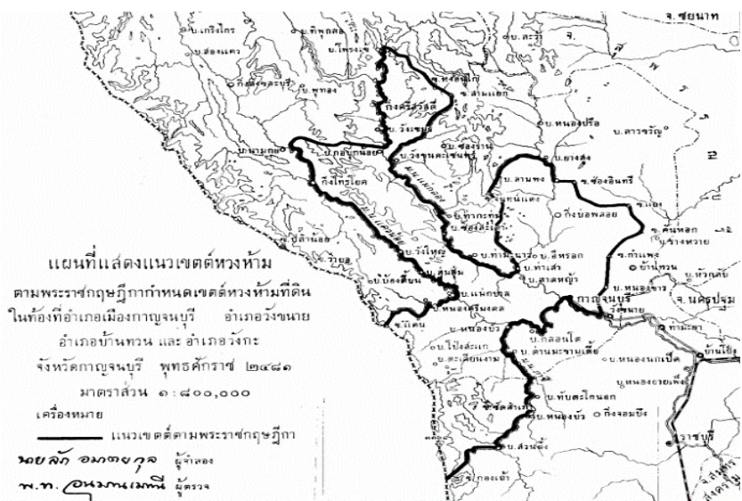
ภาพที่ 1 แผนที่แสดงแนวเขตหวงห้ามตามพระราชกฤษฎีกากำหนดเขตหวงห้ามฯ พุทธศักราช 2481 7

ทั้งนี้ ที่ดินซึ่งได้หวงห้ามไว้เพื่อประโยชน์ ตามพระราชบัญญัติว่าด้วยการหวงห้ามที่ดินรกร้าง ว่างเปล่าอันเป็นสาธารณสมบัติของแผ่นดิน พุทธศักราช 2478 หรือตามกฎหมายอื่น (รวมถึง พระราชกฤษฎีกากำหนดเขตหวงห้ามที่ดิน พุทธศักราช 2481 ในพื้นที่จังหวัดกาญจนบุรี และ จังหวัดราชบุรี) ซึ่งอยู่ก่อนวันที่ประมวลกฎหมายที่ดินใช้บังคับ ให้คงเป็นที่หวงห้ามต่อไป ภายหลังที่ดินในเขตหวงห้ามตามพระราชกฤษฎีกานี้ กรมธนารักษ์ได้นำไปขึ้นทะเบียนที่ราช พัสตเมื่อปี พุทธศักราช 2523 ภายหลังจากการประกาศใช้ พระราชบัญญัติที่ราชพัสดุ พุทธศักราช 2518 6