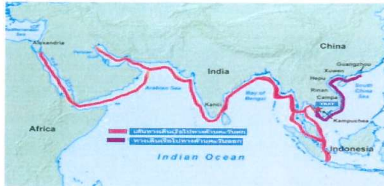
ภาพที่ 3 ภาพเส้นทางเดินเรือจังหวัดตราดไปด้านตะวันออกและตะวันตก

ทำงานจังหวัดอื่นๆ จะหลบหนีเจ้าหน้าที่เข้ามาหาที่พักชั่วคราวเพื่อรอเวลาที่เหมาะสม จึงออกเดินทางไปจังหวัดอื่นต่อไป นอกจากนั้นยังใช้เส้นทางบกหลบหนีเข้าพื้นที่ตอนในได้จาก จ.ตราด ผ่าน จว.จันทบุรี จว.ระยอง และจว.ชลบุรี เข้าสู่ กทม.ได้ (พันตรี ถาวร เมืองช้าง ,2558)