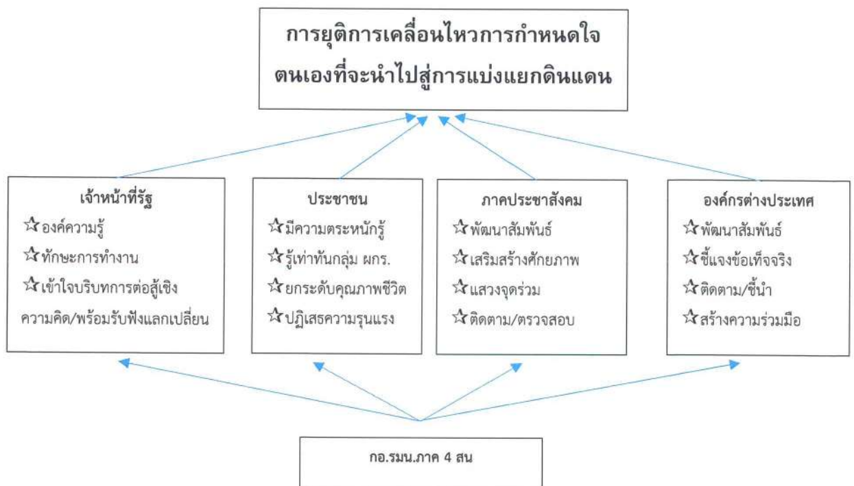
ภาพที่ 2 ทางเลือกทางยุทธศาสตร์ที่ 1

ด้านระบบโครงสร้างพื้นฐาน (Infrastructure) สภาพโครงสร้างพื้นฐานในปัจจุบัน ได้รับการพัฒนาอย่างครอบคลุมพื้นที่ พร้อมรองรับการพัฒนาและการลงทุนในอนาคต การวิเคราะห์หาแนวทางใหม่ในการพัฒนางานการเมืองเพื่อสนับสนุนการแก้ไขปัญหาจังหวัดชายแดนภาคใต้ โดยใช้ยุทธศาสตร์พระราชทาน “เข้าใจ เข้าถึง พัฒนา” , ทฤษฎีประสิทธิภาพ (Harrington Emerson) และหลักปฏิบัติการข่าวสาร (IO) กำหนดทางเลือกทางยุทธศาสตร์ จำนวน 2 ทางเลือก ดังนี้ ทางเลือกทางยุทธศาสตร์ที่ 1 ตามข้อมูลที่กล่าวมาแล้วข้างต้น จัดทำเป็นแผนภาพได้ดังนี้