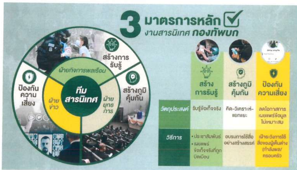
ภาพที่ 1. มาตรการหลักของงานสารนิเทศกองทัพบก. โดย ศูนย์ประสานงานสารนิเทศกองทัพบก (2564).

1.3 การป้องกันความเสี่ยง หมายถึง ความสามารถในการวางแผน การจัดการความเสี่ยงที่อาจเกิดขึ้นจากการใช้อสื่อสังคมออนไลน์ที่ไม่เหมาะสม เผื่อระวางการใช้อสื่อสังคมออนไลน์ของกำลังพลในหน่วย (ภายใน) รวมถึงการเผื่อระวาง แจ้งเตือน เมื่อมีข้อมูลข่าวสารบิดเบือน เป็นเท็จ สร้างความเกลียดชัง หรือทำให้เข้าใจคลาดเคลื่อนจากสื่อสังคมออนไลน์ (ภายนอก) สามารถค้นหา สนับสนุนข้อมูลข้อเท็จจริง หลักฐานเชิงประจักษ์แก่ผู้ที่รับผิดชอบเกี่ยวกับงานสื่อสารในสภาวะวิกฤติ