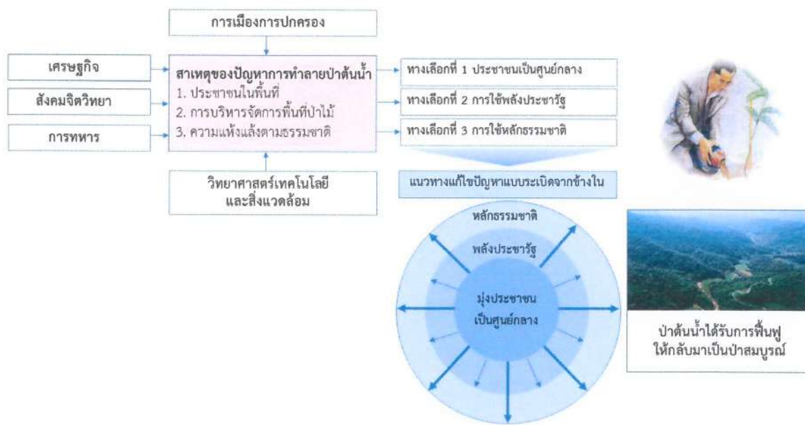
ภาพที่ 2 การแก้ไขปัญหาแบบระเบิดจากข้างใน (Inside-out)

ผู้วิจัยสรุปภาพรวมของแนวทางการแก้ไขปัญหาแบบระเบิดจากข้างใน (Insight-out) ดังแสดงตามภาพ