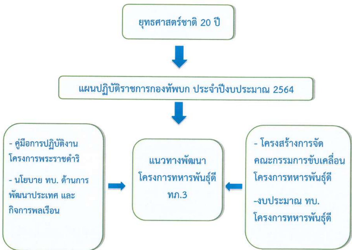
ภาพที่ 1 กรอบแนวคิดการวิจัย