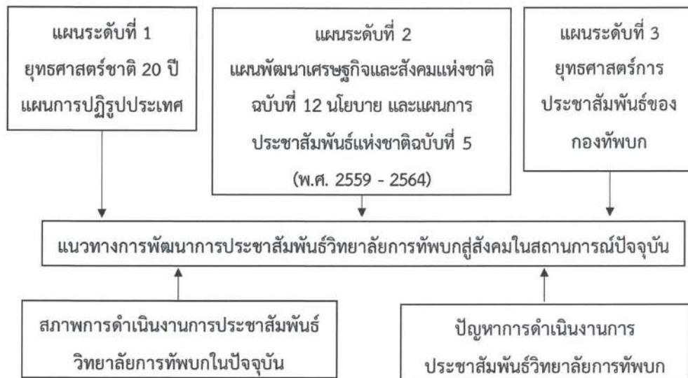
ภาพที่ 1 กรอบแนวคิดงานวิจัย