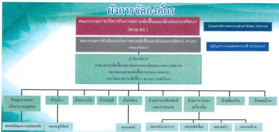
ภาพที่ 5 ผังการโครงสร้างจตุบุคลากรของสถานพักฟื้นและพักผ่อกองทัพบก ลานนา