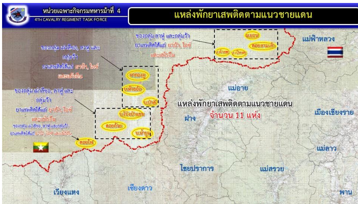
ภาพที่ 1 ภาพแสดงแหล่งพักยาเสพติดตามแนวชาย จังหวัดเชียงใหม่ 12

สำหรับข้อมูลผลการปฏิบัติการสกัดกั้นยาเสพติด ในพื้นที่รับผิดชอบของหน่วยเฉพาะกิจกรมทหารม้า ในห้วง ต.ค. 63 - เม.ย. 65 ที่ผ่านมา หน่วยมีการจับกุมทั้งสิ้น 55 ครั้ง ผู้ต้องหา 45 คน ยาบ้า 29 ล้านเม็ด ฟีน 367 กรัม เฮโรอีน 566 กรัม และไอซ์ 3 กิโลกรัม 13 ดังมีรายละเอียดตามตารางที่ 1