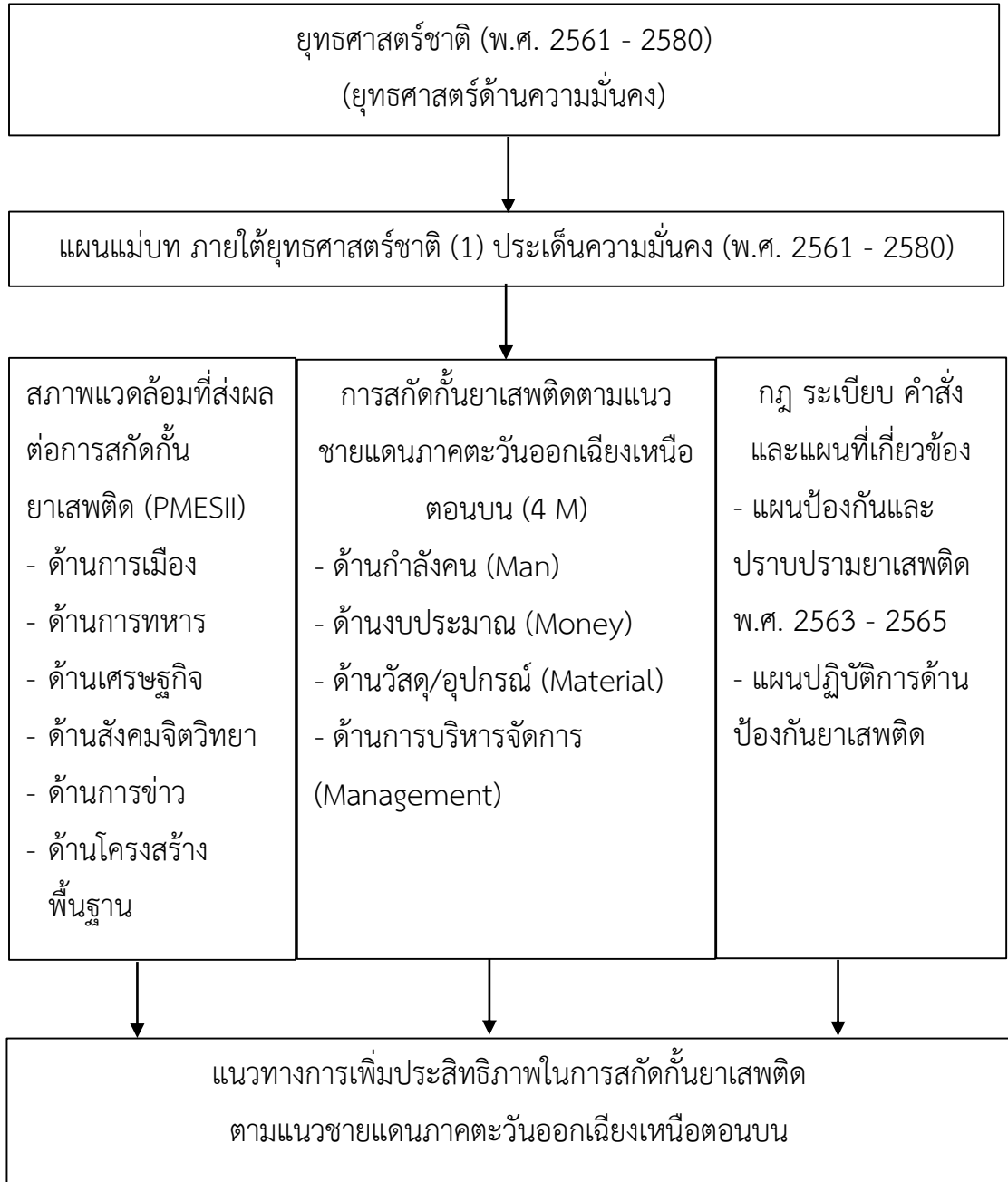
ภาพที่ 1 กรอบแนวคิดการวิจัย