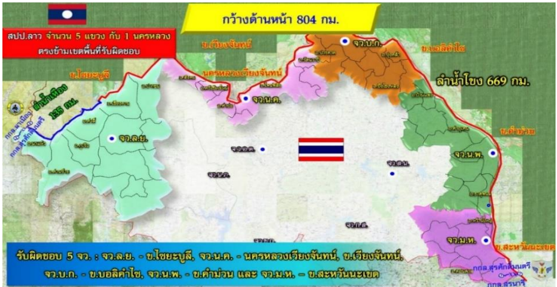
ภาพที่ 4 พื้นที่ปฏิบัติการ 5 จังหวัดชายแดนภาคตะวันออกเฉียงเหนือตอนบน