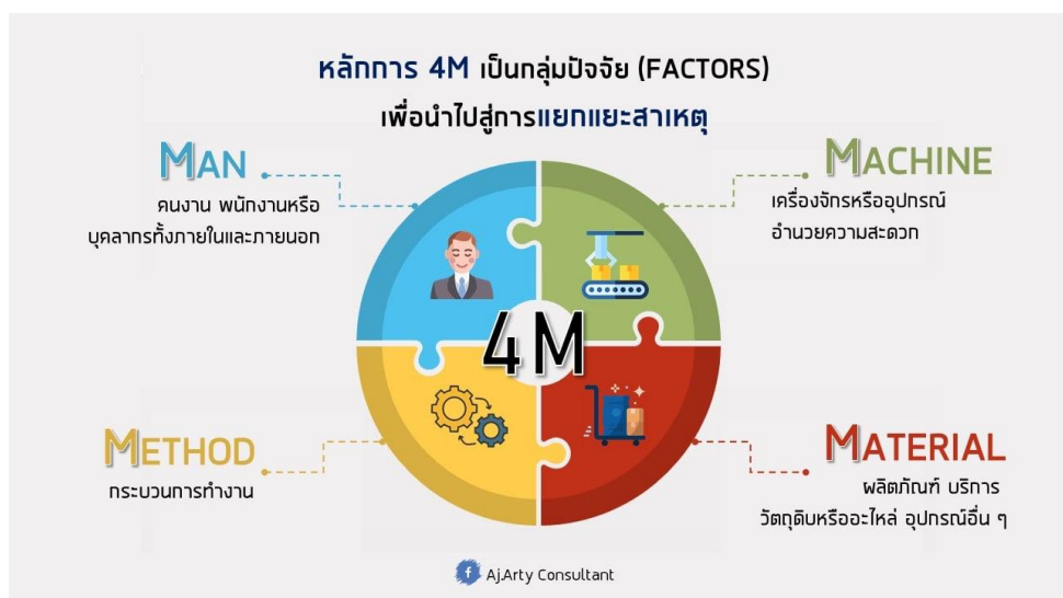
ภาพที่ 3 หลักการบริหาร 4M

ผู้วิจัยได้วิเคราะห์ปัญหาอุปสรรคของแนวทางการเพิ่มประสิทธิภาพการใช้เครื่องมือพิเศษเพื่อการควบคุมสถานการณ์ด้านความมั่นคงของหน่วยเฉพาะกิจนราธิวาส โดยใช้หลัก 4M ได้แก่ ด้านบุคลากร (Man) ด้านงบประมาณ (Money) ด้านเครื่องมือ (Material/Machine) และ ด้านการบริหารจัดการ (Management) สรุปผลดังนี้