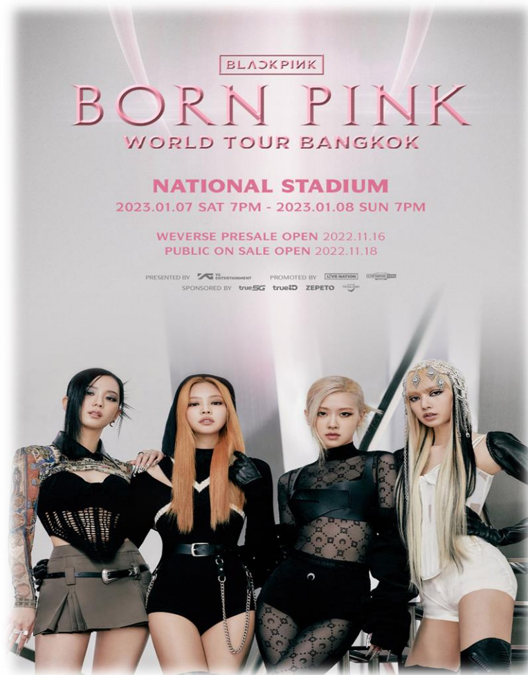
ภาพที่ 2 คอนเสิร์ต Born Pink World Tour Bangkok

โดยภาพรวมในการจัดงานแต่ละครั้ง ผู้จัดงานต้องตระหนักและระลึกถึงมาตรการรักษาความปลอดภัยตลอดจนความปลอดภัยของผู้ร่วมงานเพื่อที่จะได้มีการปรับเพิ่มงบประมาณสำหรับการรักษาความปลอดภัยเพื่อกิจกรรมดังกล่าวจะได้สมบูรณ์ยิ่งขึ้น