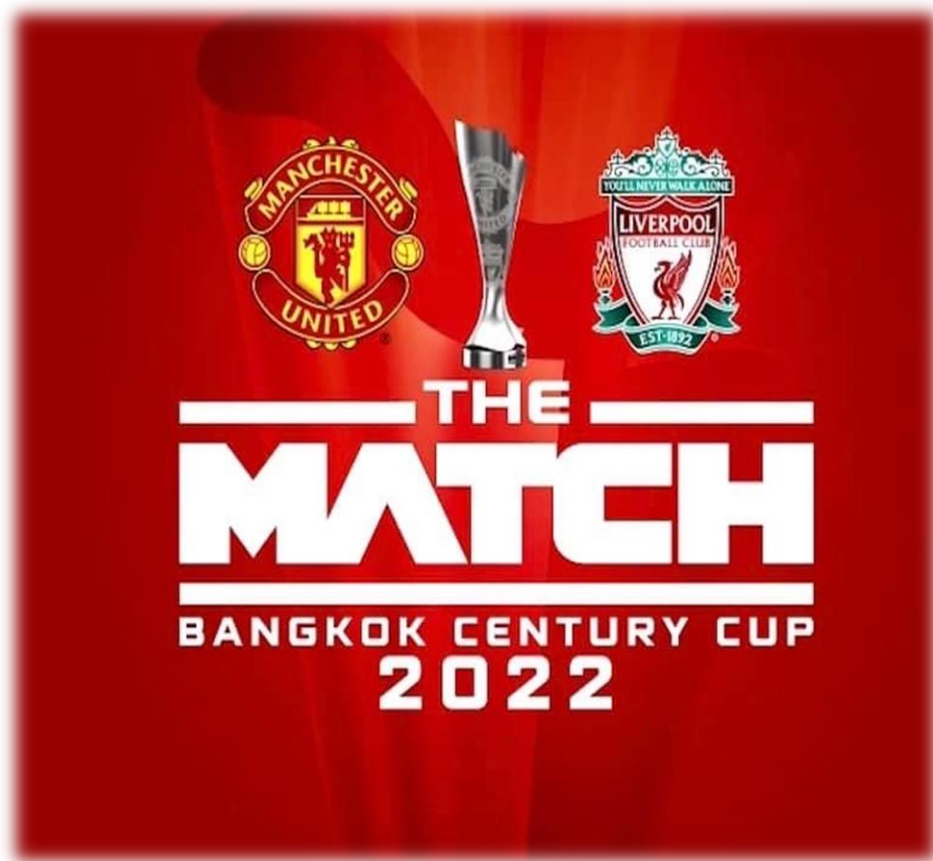
ภาพที่ 1 การแข่งขันฟุตบอล The Match Bangkok Century Cup 2022

3.5 การสร้างความประทับใจในการจัดงาน ด้วยการมอบของที่ระลึกให้กับผู้เข้าร่วมงาน เพื่อเป็นการตอกย้ำ หรือเตือนความจำเกี่ยวกับองค์กรหรือแบรนด์ขององค์กรออนไลน์ (6) สร้างการรับรู้เกี่ยวกับกิจกรรมพิเศษล่วงหน้า โดยการสื่อสารไปยังสื่อมวลชนหรือผ่านสื่อสังคม