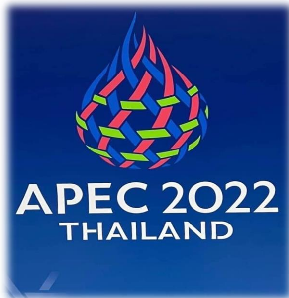
ภาพที่ 3 งาน APEC 2022 THAILAND

7. ค่านิยมร่วม (Share Value) ควรมีการเสริมสร้างวัฒนธรรมในองค์กร บริษัทรักษาความปลอดภัยให้ชัดเจน มีแบบแผน สิ่งสำคัญคือการยึดถือปฏิบัติอย่างเคร่งครัด เพื่อให้เกิดความเชื่อมั่น เป็นที่เชื่อถือต่อคนภายในองค์กรและนอกองค์กรได้ โดยเฉพาะผู้บังคับบัญชา และบุคลากร ที่ได้รับมอบหมายในการจัดการความปลอดภัยในการจัดงานเมเจอร์อีเวนต์ต้องมีวินัยในการปฏิบัติหน้าที่ มีสติรู้ตัว ปฏิบัติตนอย่างมีสติ รู้ตัว รู้คิด รู้ทำคือทำงานด้วยอย่างรอบคอบ ถูกต้อง เหมาะสม