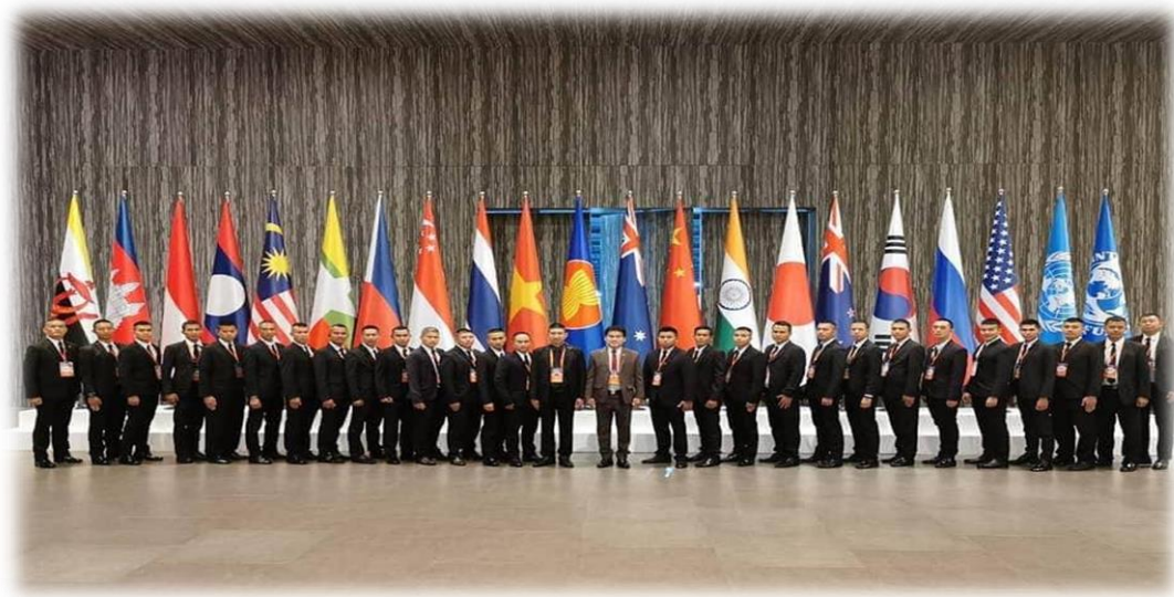
ภาพที่ 4 การประชุม Asian Summit

5. ด้านงบประมาณ พบสภาพปัญหาคือ โดยภาพรวมในการจัดงานแต่ละครั้ง ผู้จัดงานต้องตระหนักและระลึกถึงมาตรการรักษาความปลอดภัยตลอดจนความปลอดภัยของผู้ร่วมงานเพื่อที่จะได้มีการปรับเพิ่มงบประมาณสำหรับการรักษาความปลอดภัยเพื่อกิจกรรมดังกล่าวจะได้สมบูรณ์ยิ่งขึ้น โดยมีแนวทางในการแก้ไขปัญหาคือ จัดสรรงบประมาณให้สำหรับการรักษาความปลอดภัยในการจัดงานงานเมเจอร์อีเวนต์ให้เพียงพอทั้งที่นำไปใช้ในด้านต่างๆ เช่น การจัดสรรอุปกรณ์ เครื่องจักร วัสดุดิบ เป็นต้น ซึ่งการบริหารเงินเป็นเรื่องสำคัญเพราะทุกภาคส่วนมีความสัมพันธ์กันเพื่อความคล่องตัวของการหมุนเงินในบริษัท