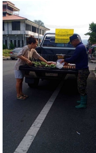
ภาพที่ 2 การเก็บผลิตผลจากแปลงเกษตรผสมผสานและนำไปจำหน่าย