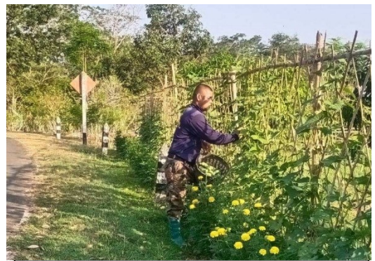
ภาพที่ 1 แปลงเกษตรผสมผสาน ดำเนินการปลูกพืชผักสวนครัว ไม้ผล และแบ่งพื้นที่บางส่วนสำหรับเลี้ยงไก่