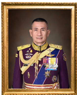
พลเอก เจริญชัย หินเธาว์