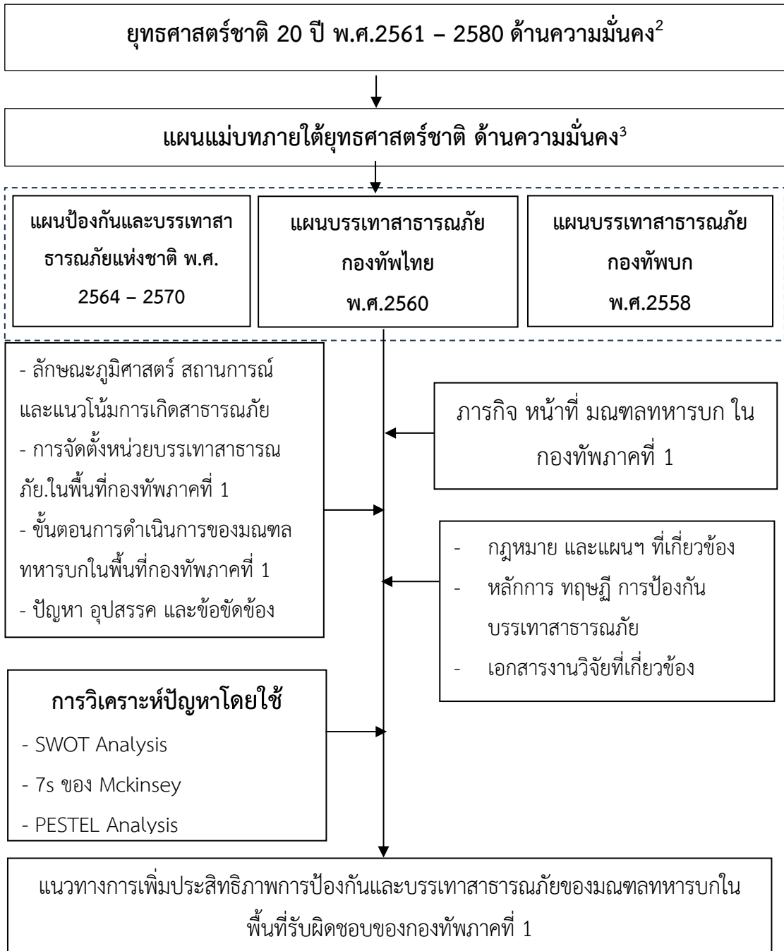
ภาพที่ 1 แสดงกรอบแนวคิดการวิจัย