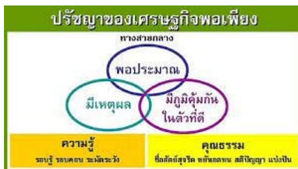
ภาพที่ 2 ปรัชญาเศรษฐกิจพอเพียง

1. แนวทางการแก้ไขปัญหานี้สินของกำลังพลกรมการสารวัตรทหารบก โดยใช้แนวคิดหลักปรัชญาเศรษฐกิจพอเพียง เศรษฐกิจพอเพียง 11 เป็นปรัชญาชี้ถึงแนวการดำรงอยู่และปฏิบัติตนของประชาชนในทุกระดับตั้งแต่ระดับครอบครัว ระดับชุมชนจนถึงระดับรัฐ ทั้งในการพัฒนาและบริหารประเทศให้ดำเนินไปในทางสายกลาง โดยการนำไปปรับใช้ในชีวิตประจำวัน ไม่ใช้จ่ายเกินตัว สร้างภูมิคุ้มกัน เช่น การทำบัญชีรายรับรายจ่าย การใช้สิ่งของในราคาที่เหมาะสม เศรษฐกิจพอเพียงเป็นแนวปรัชญาที่ทุกๆ คนสามารถนำไปปฏิบัติในชีวิตประจำวันได้ ไม่ว่าจะเป็นตัวเราเอง นักเรียน เกษตรกร ข้าราชการ และประชาชนทั่วไป ตลอดจนบริษัท ห้างร้าน สถาบันต่างๆ ทั้งนอกภาคการเกษตรและในภาคการเกษตร สามารถนำไปปฏิบัติได้ การดำเนินชีวิตตามหลักเศรษฐกิจพอเพียง คำนึงถึงหลักการ 3 ประการ ดังนี้