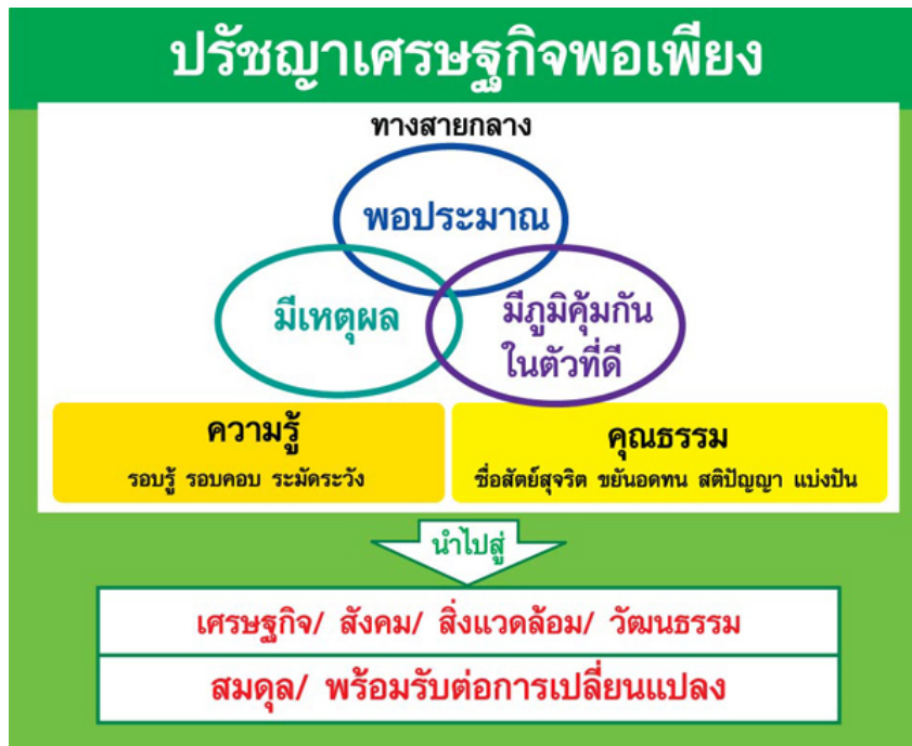
ภาพที่ 2 : ปรัชญาเศรษฐกิจพอเพียง

เศรษฐกิจพอเพียง เป็นปรัชญาที่ชี้ถึงแนวการดำรงอยู่และปฏิบัติตนของ ประชาชนในทุกระดับตั้งแต่ระดับครอบครัว ระดับชุมชนจนถึงระดับรัฐ ทั้งในการพัฒนา และบริหารประเทศให้ดำเนินไปในทางสายกลาง โดยการนำไปปรับใช้ในชีวิตประจำวัน ไม่ ใช้จ่ายเกินตัว สร้างภูมิคุ้มกัน เช่น การทำบัญชีรายรับรายจ่าย การใช้สิ่งของในราคาที่เหมาะสม เศรษฐกิจพอเพียงเป็นแนวปรัชญาที่ทุกๆ คนสามารถนำไปปฏิบัติใน ชีวิตประจำวันได้ ไม่ว่าจะเป็นตัวเราเอง นักเรียน เกษตรกร ข้าราชการ และประชาชนทั่วไป ตลอดจนบริษัท ห้างร้าน สถาบันต่างๆ ทั้งนอกภาคการเกษตรและในภาคการเกษตร สามารถ นำไปปฏิบัติได้ การดำเนินชีวิตตามหลักเศรษฐกิจพอเพียง คำนึงถึงหลักการ 3 ประการ ดังนี้