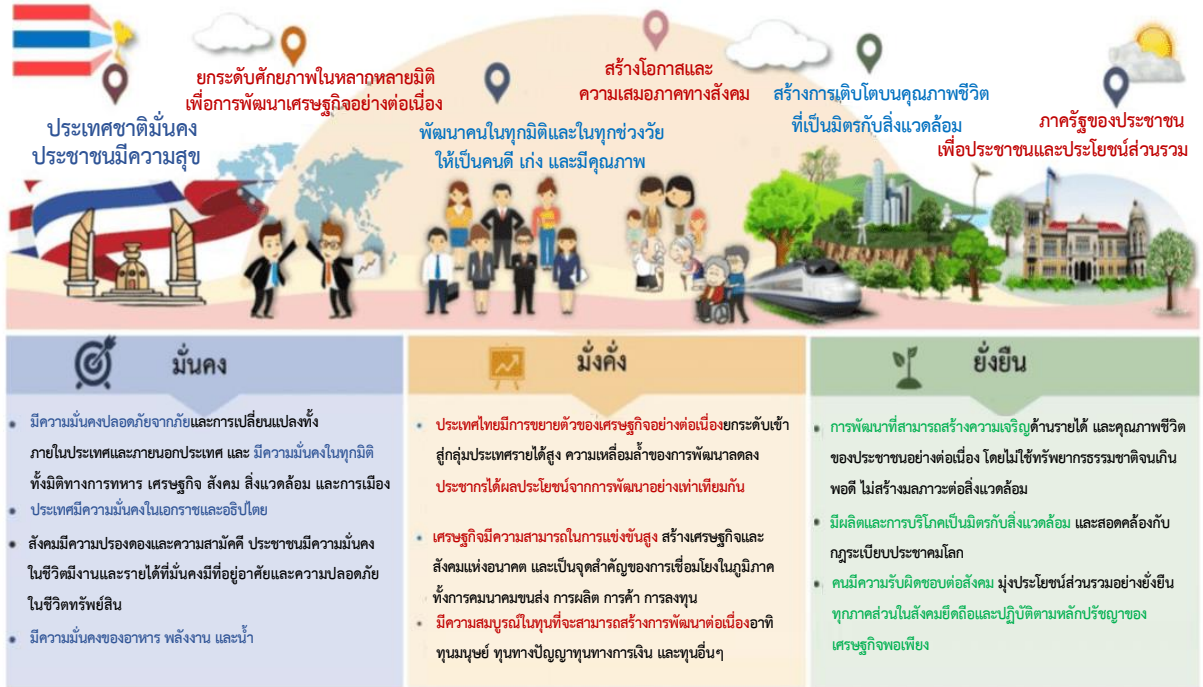
ภาพที่ 5 แผนภาพเป้าหมายอนาคตประเทศไทย ปี 2580 15

“ประเทศไทยมีความมั่นคง มั่งคั่ง ยั่งยืน เป็นประเทศพัฒนาแล้ว ด้วยการพัฒนาตามปรัชญาของเศรษฐกิจพอเพียง”