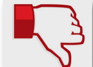
ภาพที่ 1-3 แสดงเหตุการณ์ความรุนแรงและภาพเชิงสัญลักษณ์เชิงลบต่อเหตุการณ์ความรุนแรงในพื้นที่จังหวัดชายแดนภาคใต้ 2

จากข้อความและรูปภาพดังกล่าว แสดงให้เห็นถึงการนำเสนอข่าวสารของสื่อมวลชนที่นำเสนอเหตุการณ์การก่อความรุนแรงในพื้นที่จังหวัดชายแดนภาคใต้อย่างต่อเนื่องส่งผลให้ประชาชนทั้งในและนอกพื้นที่จังหวัดชายแดนภาคใต้ ไม่เข้าใจและขาดความเชื่อมั่นต่อนโยบายการดำเนินการแก้ไขปัญหาในพื้นที่จังหวัดชายแดนภาคใต้ของรัฐบาล ทั้งยังเกิดทัศนคติเชิงลบต่อภาพการทำงานของเจ้าหน้าที่รัฐด้วย