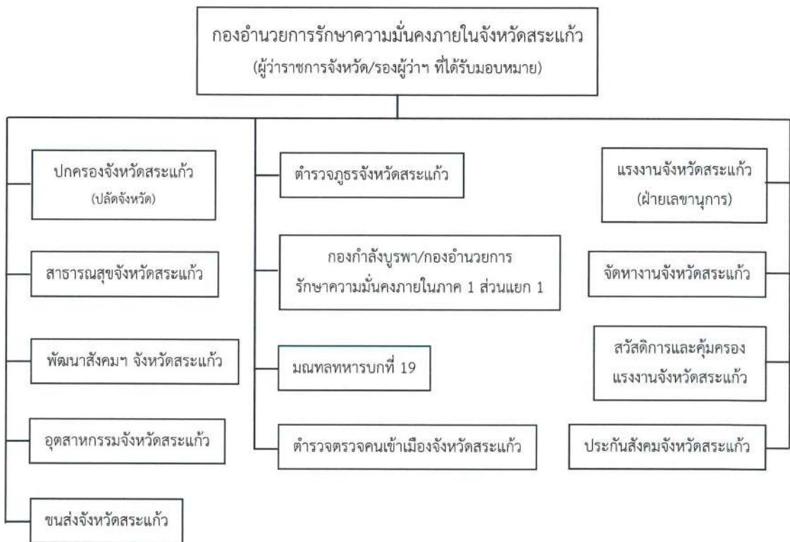
ภาพที่ 2 โครงสร้างการบริหารจัดการแรงงานต่างด้าวในพื้นที่จังหวัดสระแก้ว

ผิดกฎหมายจะต้องถูกดำเนินคดี โดยลงโทษจากเบาไปหาหนัก อาจจะเริ่มจากลงโทษจำคุกหรือกักขัง 15 ถึง 60 วัน ในช่วงแรกอาจจะใช้ขบประมาณมาก แต่ต่อไปจะน้อยลงตามลำดับ จะช่วยลดปัญหาการลักลอบเข้าเมืองและกรณีแรงงานเปลี่ยนนายจ้างบ่อย (4) การบูรณาการหน่วยงานที่เกี่ยวข้องในมาตรการป้องกันและปราบปราม โดยมีกองอำนาจการรักษาความมั่นคงภายในจังหวัดสระแก้วเป็นหน่วยงานหลัก รับผิดชอบกำกับดูแลในภาพรวม และมีแรงงานจังหวัดสระแก้วเป็นฝ่ายเลขานุการ ให้มีการจัดโครงสร้างการบริหารจัดการแรงงานต่างด้าวในพื้นที่จังหวัดสระแก้วตามภาพ