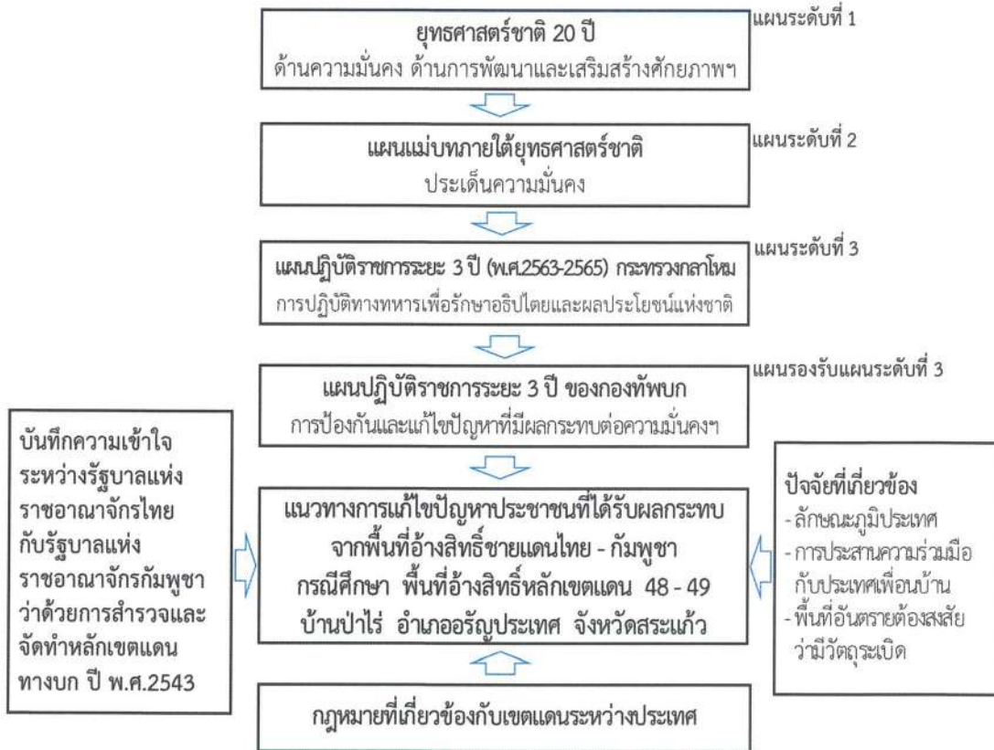
ภาพที่ 1 กรอบแนวคิดการวิจัย