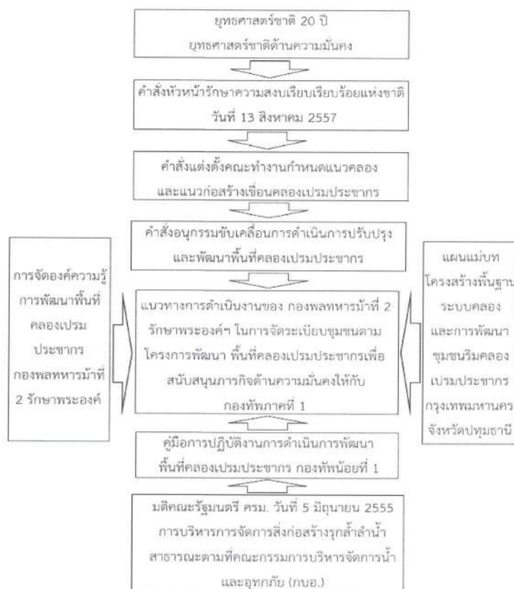
ภาพที่ 1 กรอบแนวคิดการวิจัย

จากการศึกษา ปัญหาที่เกิดขึ้นในการพัฒนาพื้นที่ในชุมชนริมคลองเปรมประชากร ในการจัดระเบียบชุมชน เพื่อสนับสนุนยุทธศาสตร์ด้านความมั่นคง จากการศึกษาค้นคว้าทบทวนแนวคิด ทฤษฎีและงานวิจัยที่เกี่ยวข้องจึงนำมาสู่กรอบแนวคิดในการวิจัยดังนี้