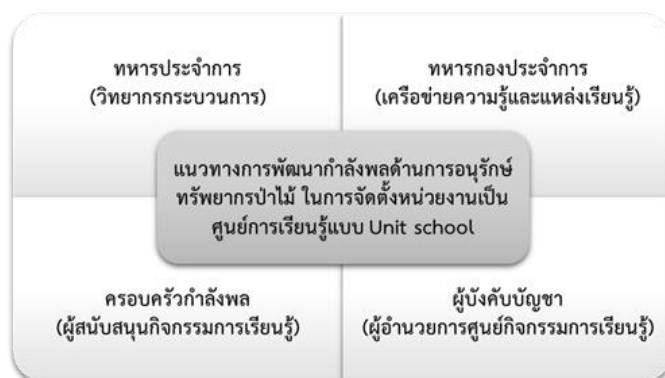
ภาพที่ 3 แนวทางการพัฒนากำลังพลด้านการอนุรักษ์ทรัพยากรป่าไม้ ในการจัดตั้งหน่วยงานเป็นศูนย์การเรียนรู้แบบ Unit school

ตามแนวคิดของการจัดตั้งหน่วยงานที่รับผิดชอบเกี่ยวกับภารกิจด้านการอนุรักษ์ทรัพยากรป่าไม้ในการกำกับและบังคับบัญชาจากกองกำลังนเรศวร โดยการปฏิบัติตามกระบวนการและรูปแบบในการทำงานนั้นเป็นไปในเชิงรุกและเชิงรับ ซึ่งในส่วนที่เป็นการปฏิบัติการเชิงรุกต้องอาศัยองค์ความรู้ อุทิศการณ์ และทักษะทางทหารเป็นสำคัญ การปฏิบัติหน้าที่ในกรอบงานดังกล่าวจึงต้องเป็นการพัฒนาทักษะทางทหาร ที่อยู่ในวงรอบของการฝึกปฏิบัติอยู่แล้ว หากในกรอบงานด้านปฏิบัติการเชิงรับ ที่มีขอบข่ายของงานในการสร้างความรู้ความเข้าใจ จิตสำนึก ตลอดจนทักษะอีกหลายด้าน เพื่อให้ประกอบการลงพื้นที่ชุมชน จึงควรมีกระบวนการแลกเปลี่ยนเรียนรู้ ถ่ายทอดประสบการณ์ ตลอดจนเสริมสร้างองค์ความรู้ และฝึกฝนทักษะที่เกี่ยวข้องกับการปฏิบัติ รวมทั้งการสร้างเครือข่ายในการทำงาน เพื่อให้เกิดประสิทธิภาพและประสิทธิผลในการอนุรักษ์ทรัพยากรป่าไม้อย่างเป็นรูปธรรม การพัฒนากำลังพลในแต่ละกลุ่มควรมีแนวทางดังต่อไปนี้