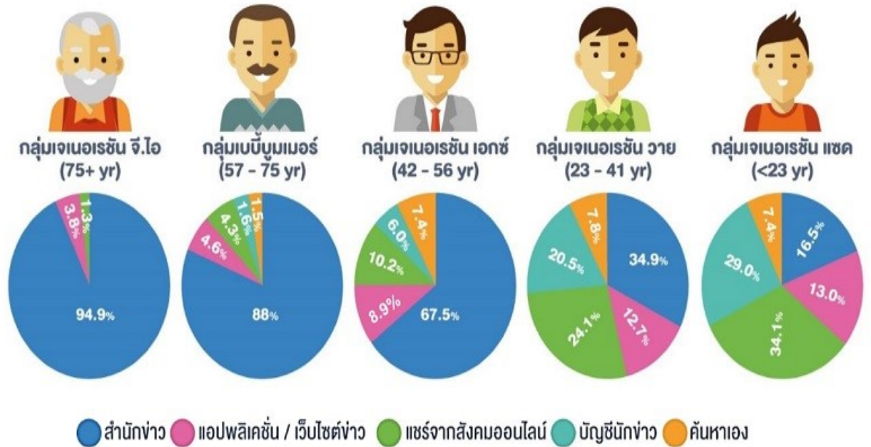
ภาพที่ 1 ช่องทางการติดตามข้อมูลข่าวสาร จำแนกตามกลุ่มอายุ