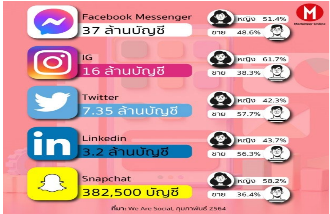
ภาพที่ 2 โลกโซเชียลมีเดียของคนไทยในปี 2564

ผู้ทำวิจัยได้ค้นคว้าข้อมูลทำให้พบว่าในปัจจุบันคนไทยมีการใช้ช่องทางการรับฟังข้อมูลข่าวสารโดยจำแนกตามอายุ ตามภาพที่ 1 โดยในกลุ่มที่มีอายุตั้งแต่ 42 ปีขึ้นไปจะฟังข่าวสารผ่านช่องทางสำนักข่าวเป็นส่วนใหญ่ ส่วนกลุ่มที่อายุ 42 ปีลงมาจะใช้สื่อสังคมออนไลน์เป็นส่วนใหญ่ และตามภาพที่ 2 พบว่าโลกโซเชียลมีเดียของคนไทยในปี 2564 จะนิยมใช้ เฟซบุ๊ก (Facebook) อินสตาแกรม (Instagram) ทวิตเตอร์ (Twitter) เป็น 3 อันดับต้นๆ