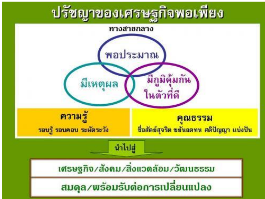
ภาพที่ 2 ปรัชญาของเศรษฐกิจพอเพียง 17

ความพอประมาณ หมายถึง ความพอดีต่อความจำเป็น และเหมาะสมกับฐานะของตนเอง สังคม สิ่งแวดล้อม รวมทั้งวัฒนธรรมในแต่ละท้องถิ่น ไม่มากเกินไป ไม่น้อยเกินไป และต้องไม่เบียดเบียนตนเองและผู้อื่น